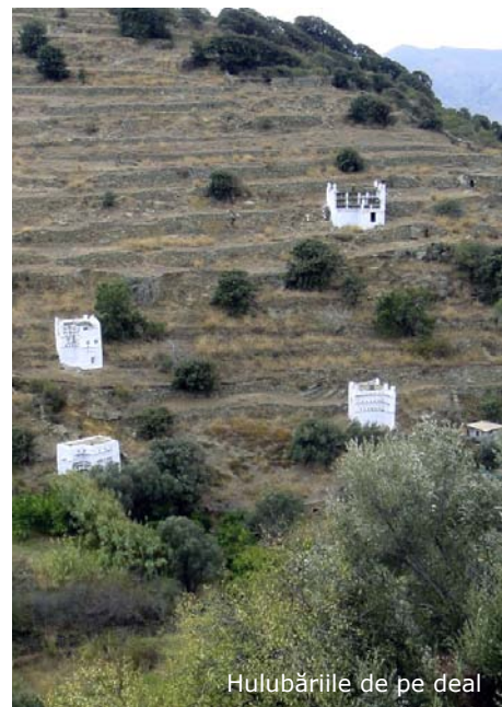
Hulubăriile de pe deal

locuitorii au făcut cărări, garduri și terasări pe tot teritoriul insulei.