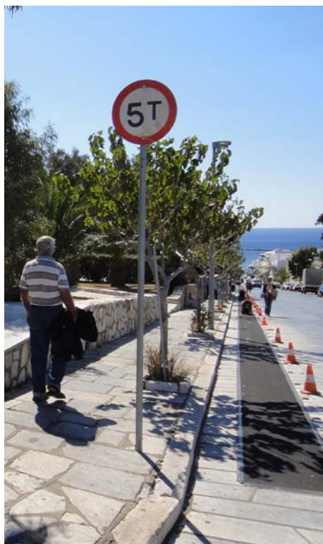
Urcușul în genunchi de la port la biserică