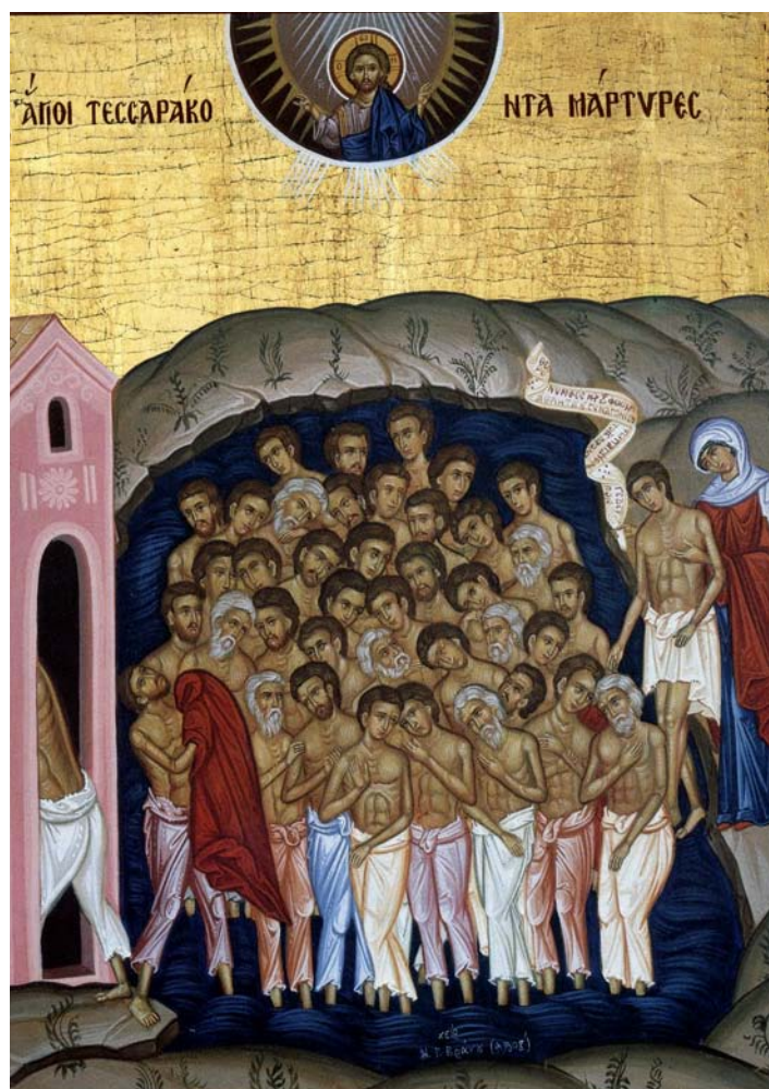
Cei 40 de mucenici din Cetatea Sevastiei

Misiunea Bisericii, indiferent în ce timp și loc, impune a se ține seama de cel puțin două coordonate: ceea ce este Biserica, viața și credința ei, și ceea ce este contextul imediat. În cele ce urmează, intenționez să prezint rezultatele unei cercetări – desfășurate pe mai bine de doi ani – asupra unor mărturii importante ale Bisericii primare, scrierile Părinților apostolici și actele martirice. Intențiile mele au fost acelea de a descoperi principalele repere ale credinței Bisericii, acelea care îi permit să fie ea însăși, indiferent în ce context istoric, social, cultural, mai ales că, în era modernă, în conjuncturi nefavorabile, pare că