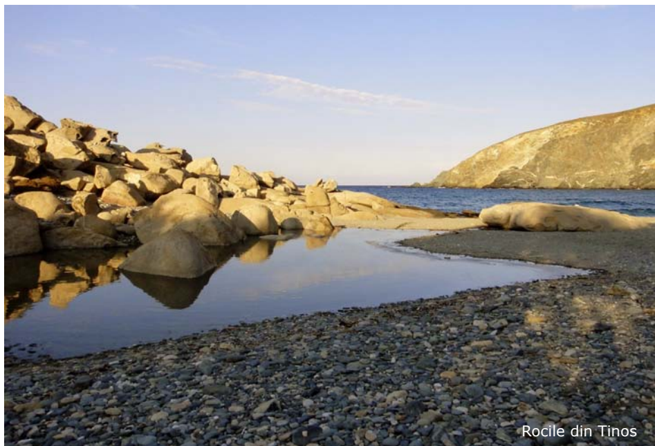
Rocile din Tinos