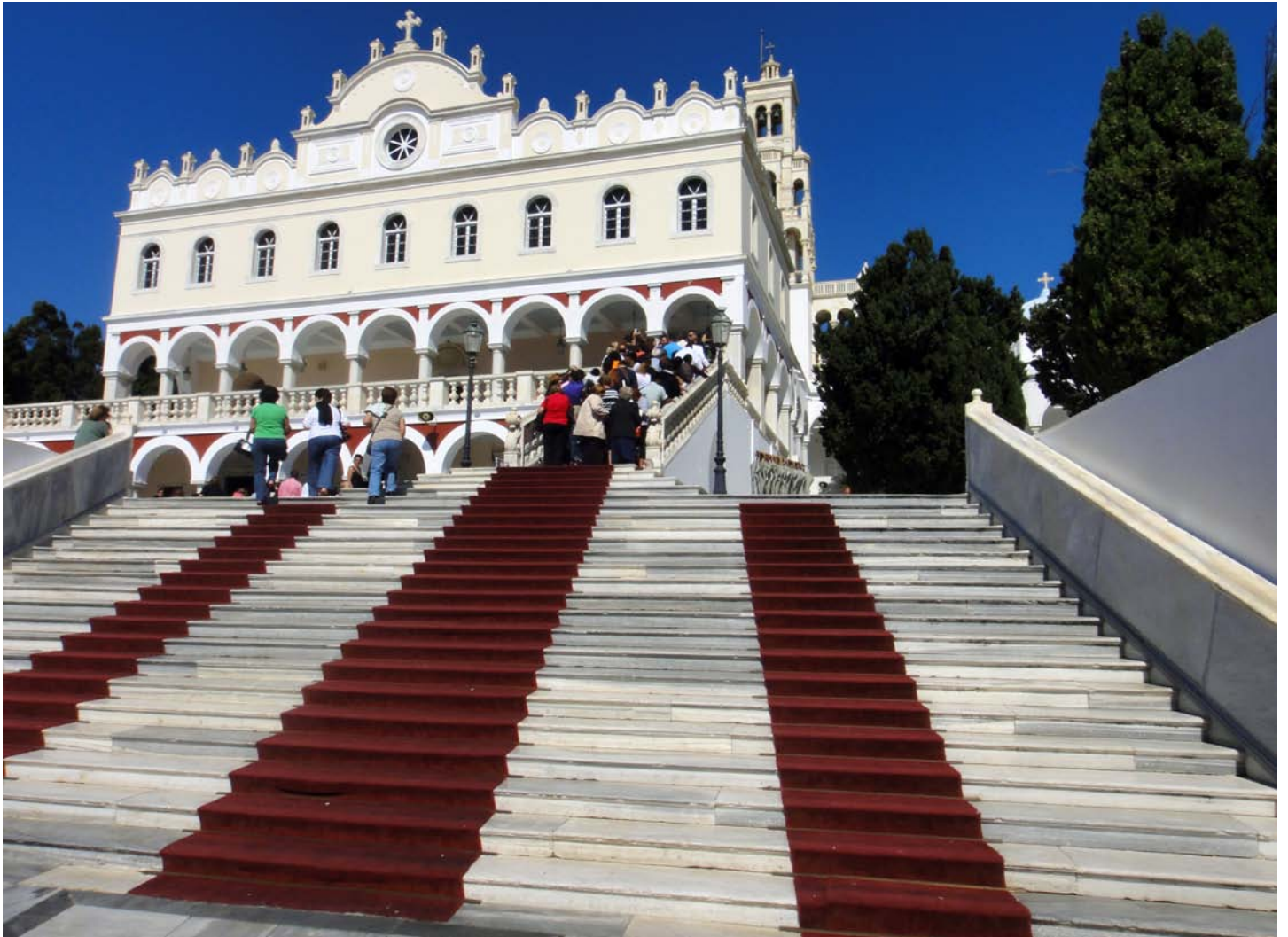
Biserica Bunei Vestiri din Tinos