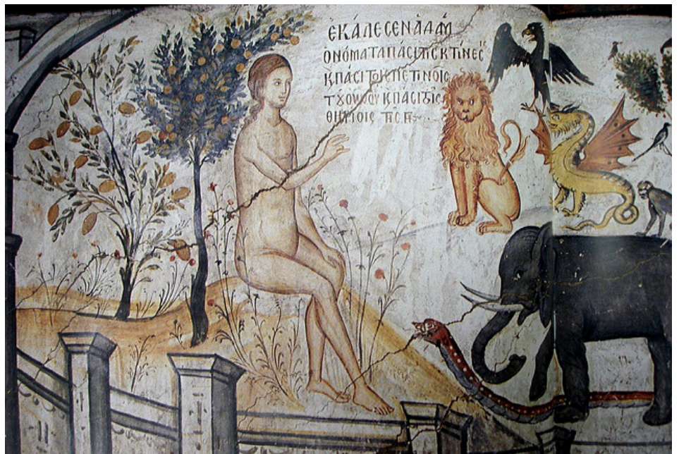
Adam punând nume animalelor, pictor monahul Teofan Cretanul, biserica mănăstirii Sfântul Nicolae Anapafsas – Meteora, 1527

În aceeași linie, Olivier Clément afirmă: